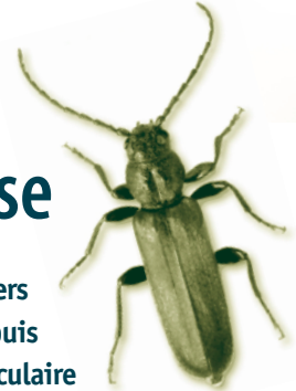
Longicorne brun de l'épinette.

La détection constitue un élément clé de tout plan de prévention contre les ravageurs forestiers exotiques. Dans cet objectif, des chercheurs du Service canadien des forêts (SCF) travaillent depuis plusieurs années au développement d'outils de détection dont des trousse de diagnostic moléculaire spécifiques aux ravageurs les plus menaçants pour nos forêts.