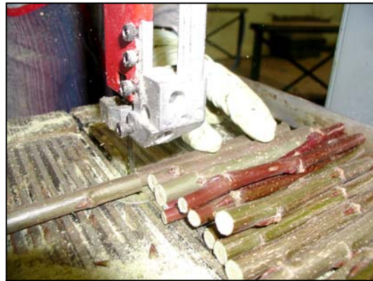
Photo 3 : Coupe des tiges de pieds-mères en boutures avec une scie à ruban

Les plants de peupliers hybrides utilisés pour le reboisement sont des clones et ont donc exactement le même bagage génétique que les plants sélectionnés au départ par le ministère des Ressources naturelles et de la Faune. Contrairement à d'autres essences multipliées par bouturage comme le mélèze hybride, les peupliers n'ont pas de problèmes à être clonés à répétition.